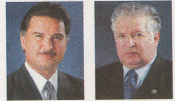
PRESIDENTE ALFONSO PORTILLO