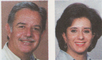
PRESIDENTE OSCAR BERGER