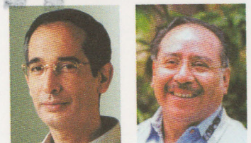
PRESIDENTE ALVARO COLOM CABALEROS