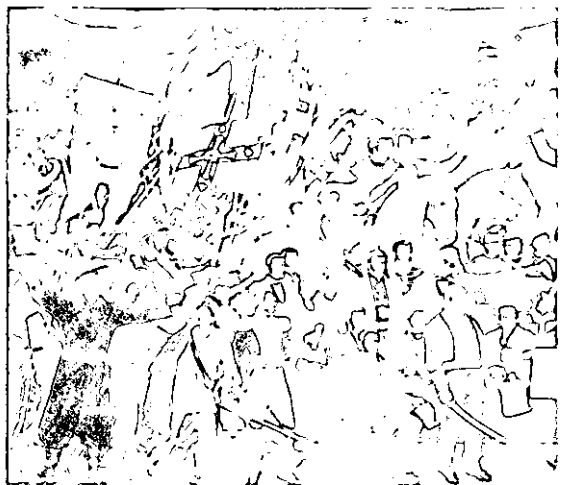
Mural de Juan O'Gorman

El anhelo por la libertad y la justicia, la aspiración a mejores condiciones de vida, así como la inconformidad ante la desigualdad social y la discriminación racial que imperaban en la Nueva España, motivaron que un grupo de patriotas se propusiera generar un movimiento en favor de la independencia. Primero en Valladolid, y posteriormente en Querétaro, una supuesta academia literaria integrada por los militares Ignacio Allende y Juan Aldama, el párroco de Dolores, Miguel Hidalgo, el corregidor de Querétaro, Miguel Domínguez y su esposa Josefa Ortiz de Domínguez, así como otros criollos, organizó una conspiración contra el gobierno virreinal. El foco principal de la insurrección, que estaba en Querétaro, fue