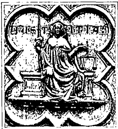
Alegoría de la Justicia, por Andrés Pisano