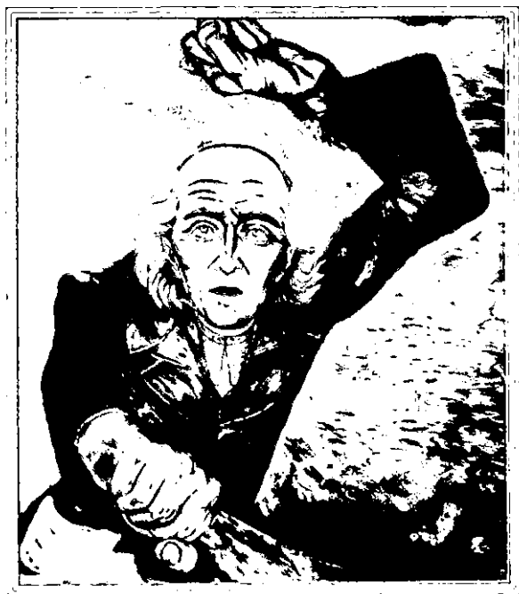
Miguel Hidalgo, iniciador del movimiento de Independencia