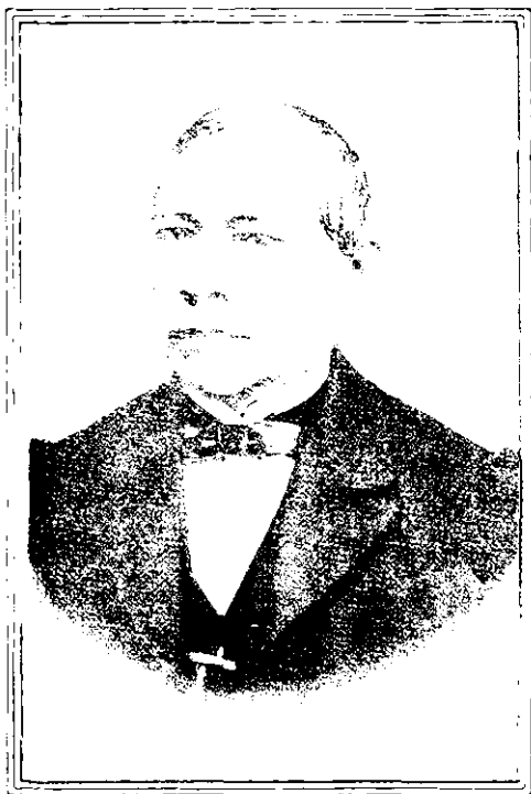
Benito Juárez, artífice del triunfo de la República sobre la Intervención Francesa