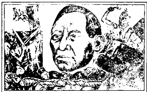
Mural de José Clemente Orozco

Las guerras civiles en México, la suspensión de los pagos de la deuda externa, la guerra de secesión en los Estados Unidos y las ambiciones expansionistas de Napoleón III, fueron factores que aprovecharon un grupo de conservadores para promover la intervención francesa contra el gobierno de Benito Juárez (1861-1867).