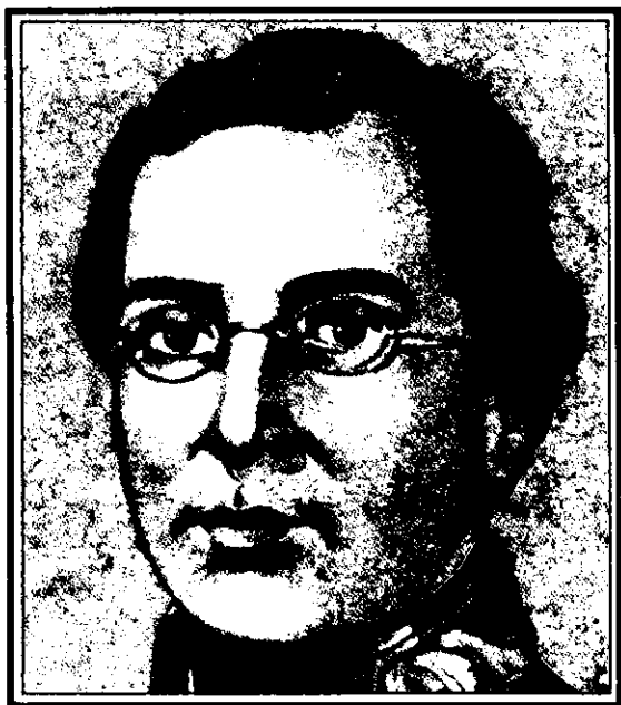
Ignacio Zaragoza, héroe de la batalla contra los franceses