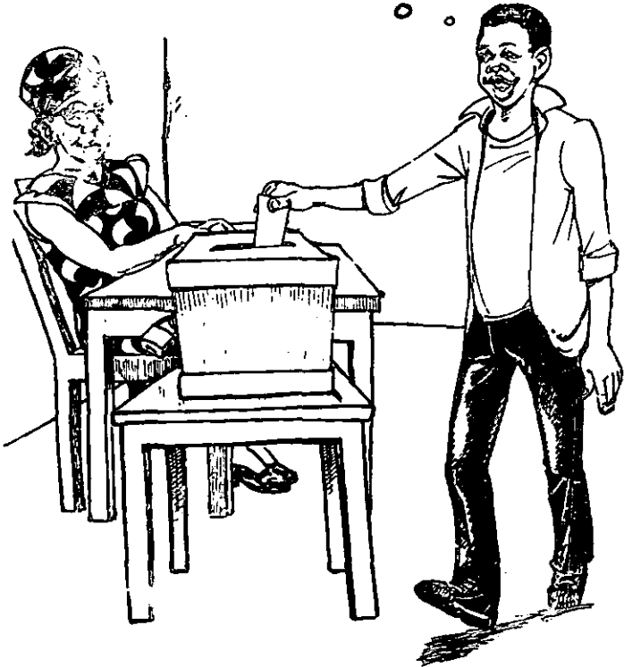
Tumbukiza kwenye kisanduku kinachobusika

KURA YANGU NI MUHIMU: KWA KUMPATA KIONGOZI BORA.