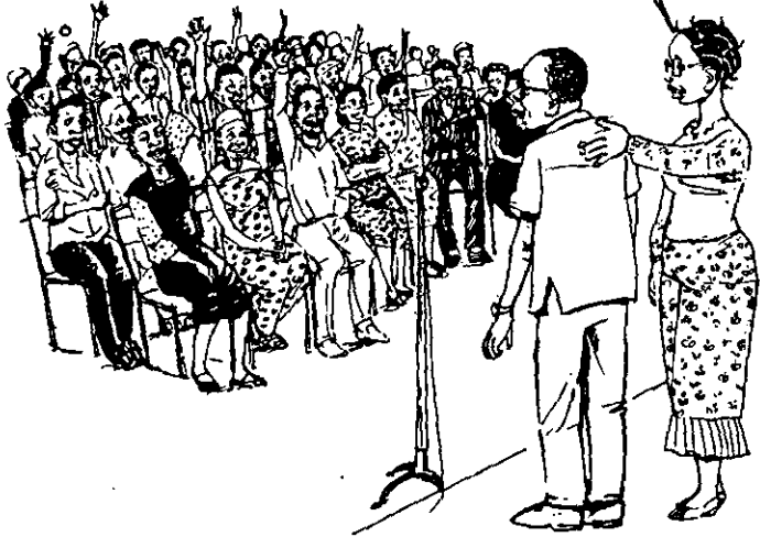
Shiriki katika uteuzi wa mgombea ambaye utataka awe mwakilishi wako.

HUWI BWANA ANAOMBA KUPENDEKEZWA KUGOMBEA UWAKILISHI WA JIMBO HILI NAOMBA TUMSIKILIZE.