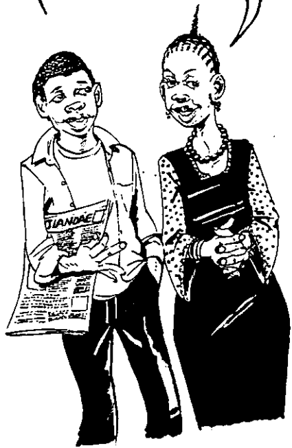
Watu hawa walifuatilia utaratibu wa kujiandikisha na kupiga kura ili kumpata kiongozi bora kwa maendeleo ya taifa. •

NI VYEMA ILI TUTUMIE HAKI YETU YA KUPIGA KURA