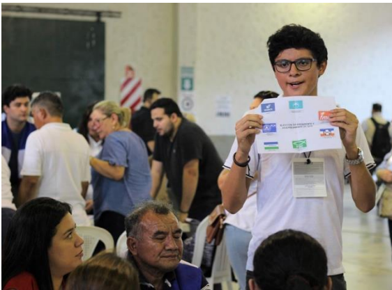
خلال عملية فرز الأصوات، على موظفي الاقتراع عرض كل ورقة اقتراع للمراقبين وممثلي الأحزاب لكن عن بعد

في العديد من البلدان يبدأ الجزء الأساسي من عملية نتائج الانتخابات في مراكز الاقتراع بالاحتساب اليدوي لأوراق الاقتراع من قبل موظفي الاقتراع. وبالتالي يتم تجميع أوراق النتائج من كل مركز اقتراع، غالباً على مستوى الدائرة الانتخابية ويتم الإعلان عن النتائج من قبل رئيس مكتب احتساب الأصوات. تستخدم دول أخرى آلات الاقتراع الإلكترونية للتسجيل المباشر في مراكز الاقتراع والتي تقوم تلقائياً باحتساب عدد الأصوات وإرسال النتائج إلى موقع مركزي للتحقق والتجميع. في بعض الحالات، يحدد الناخبون خياراتهم على بطاقات الاقتراع الورقية التي يتم بعد ذلك مسحها ضوئياً ومعالجتها.