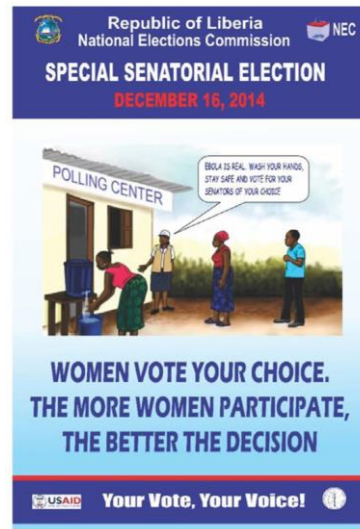
مثال عن مواد تثقيف الناخبين في لايبيريا خلال تفشي الإيبولا عام 2014