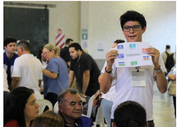
Під час підрахунку голосів члени дільничних комісій мають показати кожен бюлетень на відстані спостерігачам та уповноваженим особам партій.

У багатьох країнах основна частина процесу встановлення результатів виборів починається на виборчих дільницях з ручного підрахунку членами дільничних комісій паперових бюлетенів. Після цього протоколи з результатами з окремих виборчих дільниць збираються до купи, часто на рівні округу, і голова окружної виборчої комісії оголошує результати. Інші країни використовують пристрої для електронного голосування на виборчих дільницях, які фіксують подані голоси, автоматично підраховують їх кількість і передають результати до центрального пункту для верифікації та підсумовування. У деяких випадках виборці вказують свій вибір на паперових бюлетенях, які потім скануються та обробляються.