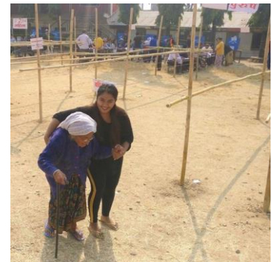
Жінка отримує допомогу, щоб проголосувати в Непалі. Вимог щодо фізичної дистанції не завжди можна дотриматись при голосуванні зі сторонньою допомогою, тож рекомендуються ІЗЗ.

Облаштування туалету або кімнати відпочинку пов'язане з унікальними викликами при масових зібраннях, оскільки важко контролювати поведінку у відокремлених місцях, а йдеться про місце, де, найімовірніше, відбувається обмін тілесними рідинами. Особи, котрі погано почуваються, також, імовірно, шукатимуть це місце, коли кашлятимуть. Щоб миття рук було простішим і доступнішим і не допускати скупчення людей в кімнатах відпочинку, всередині