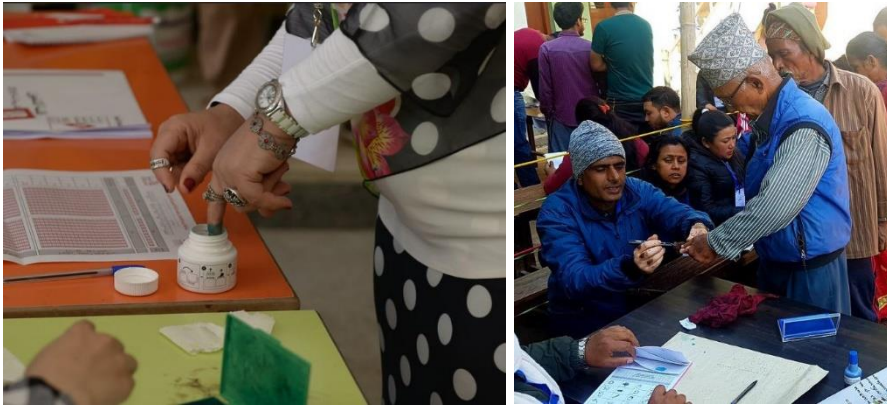
Незмивне чорнило може застосовуватись членами дільничних комісій або виборцями безпосередньо. Перевагу слід віддати аплікаторам, що зменшують потребу в контакті між людьми.

Дезинфекція рук перед процедурами знову-таки рекомендується – для уникнення забруднення самого реєстру виборців. Виборець також має дочекатись, доки руки повністю висохнуть, щоб не пошкодити папір. Більшість біометричних сканерів та пристроїв для електронного голосування вимагають, щоб виборець доторкнувся до екрана. Як і в рекомендації щодо пристроїв біометричної реєстрації виборців, ОАВ має зв'язатися з виробниками, щоб отримати детальні інструкції щодо того, які продукти можна використовувати і як їх використовувати для дезинфекції обладнання, не пошкодивши його. Безконтактна технологія на основі відбитків пальців та пристрої розпізнавання облич, у разі наявності, будуть кращими варіантами, оскільки вони дозволяють повністю уникнути ризику фомітів. Пристрої для електронного голосування зазвичай також вимагають, щоб виборці торкалися екранів або кнопок, тож ОАВ повинен навчитись дезинфікувати обладнання без його пошкодження або використовувати одноразову захисну плівку чи інші напівпрозорі матеріали для уникнення прямого контакту з цими поверхнями.