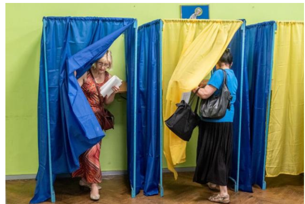
Хоча завіски допомагають зберегти таємницю голосування в Україні, та, щоб зменшити ймовірність передачі вірусу, їх не слід використовувати під час кризи COVID-19.

Слід також ретельно розпланувати виборчу дільницю. Розташування столів та стільців для членів дільничних комісій має відповідати вимогам щодо фізичної дистанції, а члени комісії повинні контролювати потік виборців на кожній стадії процесу голосування, щоб не допускати контакту між людьми і виділяти час на дезінфекцію будь-якого обладнання. ОАВ має також подумати про вилучення будь-яких дій, що можуть призвести до непотрібного торкання предметів. Наприклад, ОАВ може віддати перевагу будинкам з меншою кількістю дверей або з дверима, що відкриваються й зачиняються автоматично, для уникнення торкання ручок, і використанню фіксованих кабінок замість завісок, щоб виборці не торкались тканини. Слід унеможливити сидіння поруч кількох осіб, особливо прибрати лавки та розташовані поруч один з одним стільці; на дільниці слід мати якомога менше непотрібних об'єктів і поверхонь, якщо це можливо. У разі наявності можна встановити плексигласові або інші напівпрозорі екрани на столах, щоб додати захисний бар'єр між членами дільничної комісії та виборцями і посприяти блокуванню перенесення вірусних крапель від однієї людини до іншої. Ці екрани слід часто дезінфікувати.