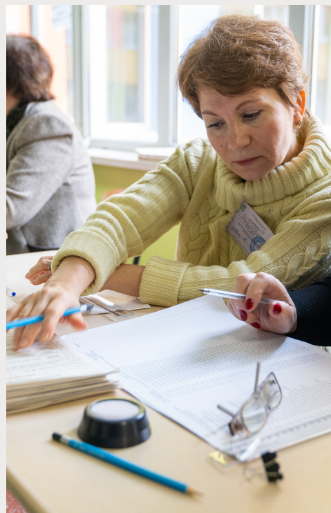
Los trabajadores electorales en Ucrania examinan la lista de votantes durante la primera ronda de las elecciones presidenciales el 31 de marzo de 2019.

La siguiente tabla incluye los indicadores sensibles al género nuevos o modificados, la justificación para su inclusión en este marco, las consideraciones para